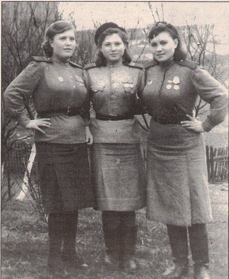
У войны... женское лицо.

нему лупят из всех орудий, а он крыльями по-нашему машет, мол, я же свой, свой! Сел удачно, неподбитый, и за это ему присвоили «Дважды Героя». Только до конца войны он не дожил – такой был лихой, до самого набора высоты не любил